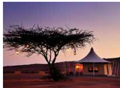
Toute la magie du Desert Nights Camp, dans le Wahiba.

Desert Nights Camp (00.968.24.702.311 ; www.desertnightscamp.com ), dans le désert de Wahiba. Un campement isolé au cœur des sables rouges. Des tentes suffisamment espacées ; une déco orientale simple et charmante. Le soir, les joueurs de oud prennent place sur les coussins, et les étoiles scintillent. Compter 355 € la double, 620 € la tente familiale.