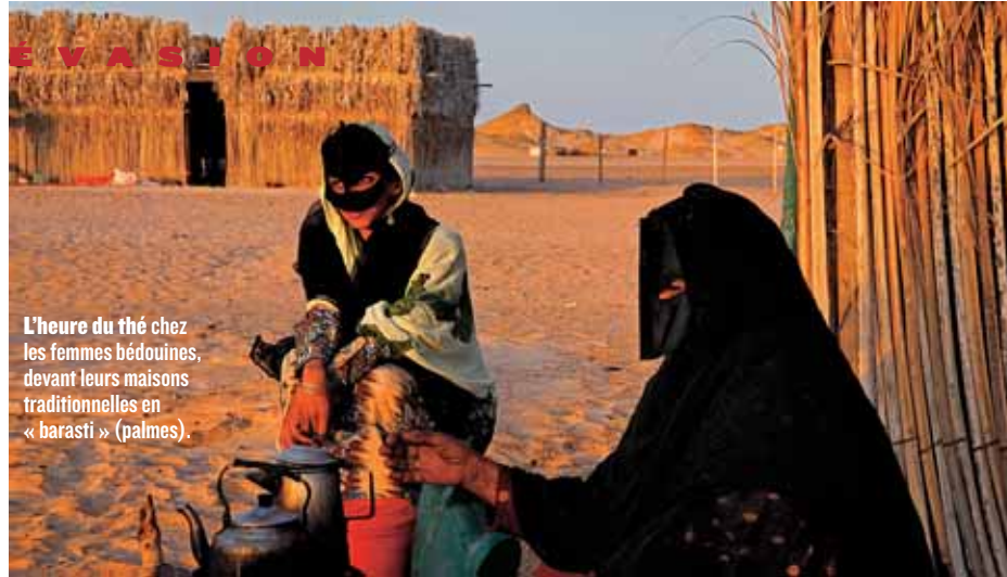
L'heure du thé chez les femmes bédouines, devant leurs maisons traditionnelles en « barasti » (palmes).