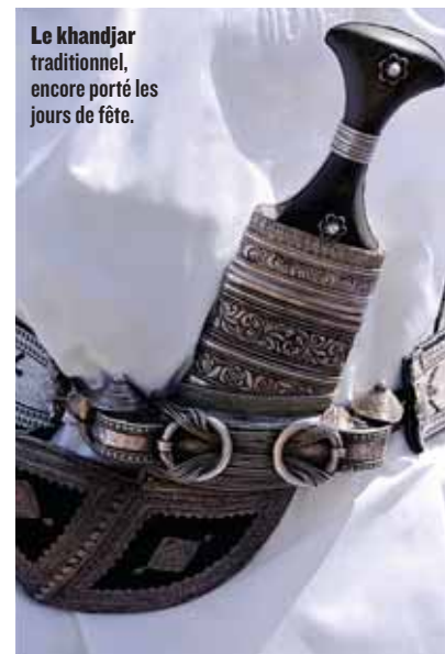
Le khandjar traditionnel, encore porté les jours de fête.