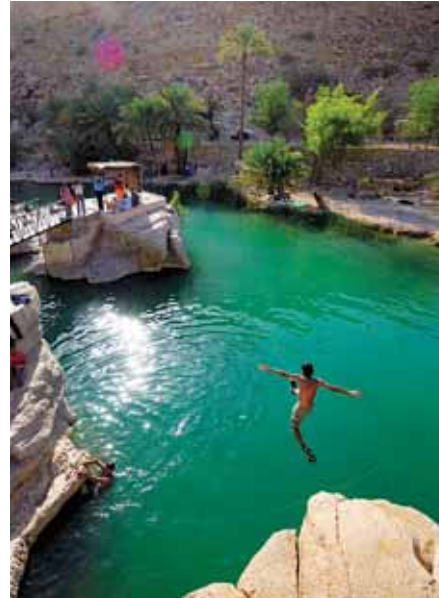
Entretenus avec soin, les arbres à encens du Wadi Dawkha sont classés au patrimoine mondial de l'Unesco. A droite, un plongeur dans les eaux fraîches du Wadi Bani Khaled.