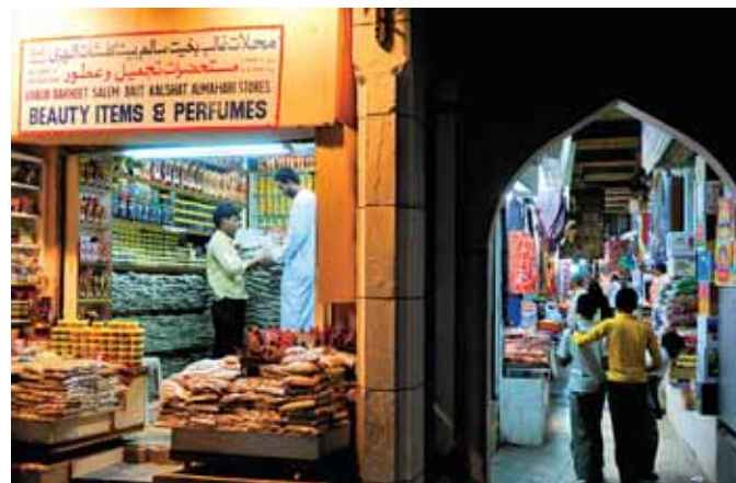
Un aperçu du souk de Mascate, cœur vibrant de la capitale, où l'on trouvera encens, étoffes, épices, bijoux et, pour les chanceux, le fameux miel de jubbier.

* Le Sultanat d'Oman , éditions Karthala, 2000.